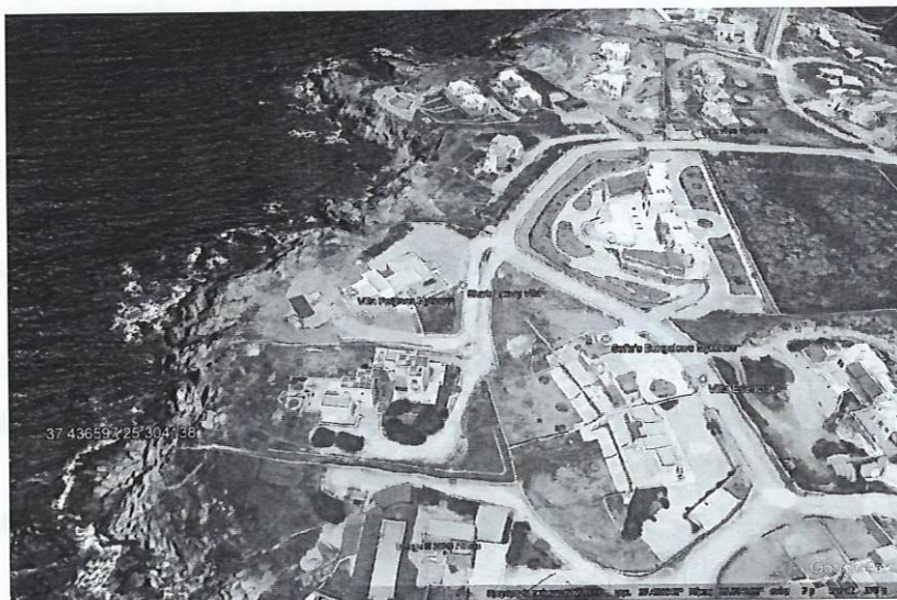
Κάτοψη της δραστηριότητας σε εικόνα Google Earth (Ημ/νία λήψης 06-06-2023)

Μετά από έρευνα στο αρχείο της Υπηρεσίας μας δεν βρέθηκαν τυχόν εκδοθείσες άδειες ή λοιπά διοικητικά έγγραφα σε σχέση με την υπόψη δραστηριότητα.